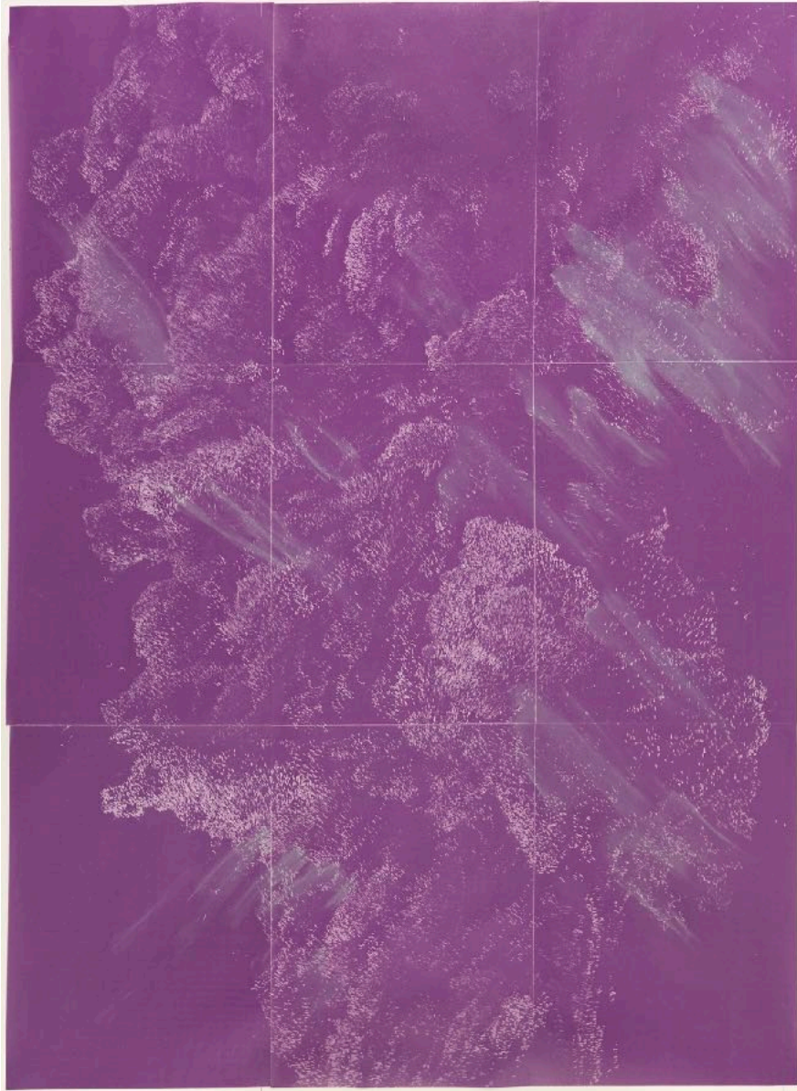
Untitled (Volcano #2)